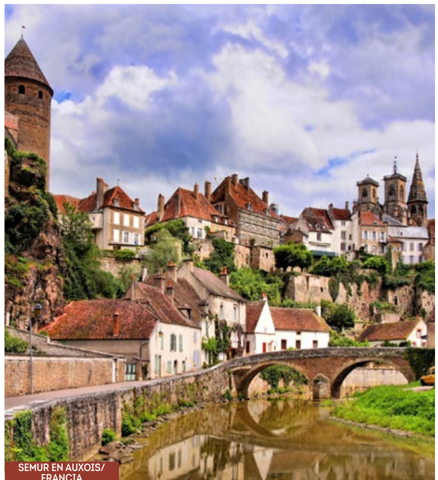
SEMUR EN AUXOIS/ FRANCIA