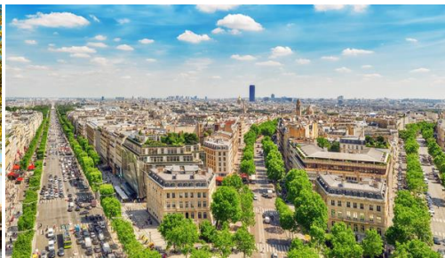
Hermosa vista panorámica de Paris.