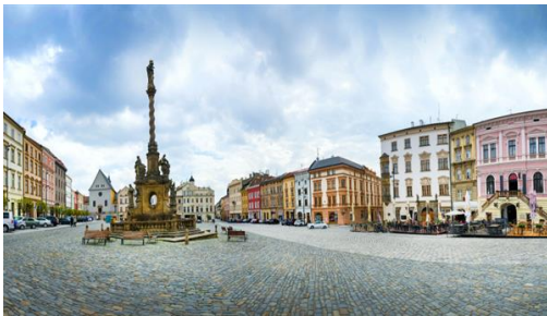
Olomouc: Una de las localidades más hermosas y mejor conservadas del país.

Hoy viajamos a Austria. Conocemos SALZBURGO, la ciudad de Mozart, con su centro renacentista y barroco de gran belleza a la sombra de potente castillo medieval. Continuamos posteriormente nuestra ruta entre lagos y montañas. Etapa de muy gran belleza paisajística en los Alpes; paramos en ST. WOLFGANG, famoso lugar de peregrinación en Austria. Continuamos a TRAUNKIRCHEN junto al hermosísimo lago de TRAUNSEE, incluimos cruce por el lago divisoando cuatro castillos y desembarcando en GMUNDEN. Continuación hacia VIENA, llegada al final de la tarde. Fin de nuestros servicios. Compruebe la hora de su vuelo por si necesitase una noche adicional.