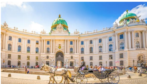
Alte Hofburg de la magnífica capital de Austria, Viena