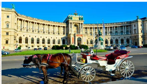
Viena: Palacio Hofburg.