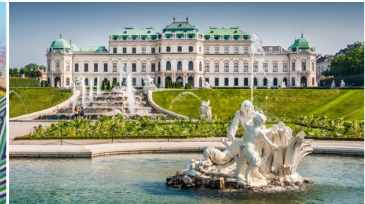
Hermosa vista del famoso Schloss Belvedere, construido por Johann Lukas von Hildebrandt como residencia de verano para el Príncipe Eugenio de Saboya, en Viena.