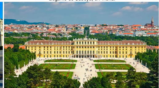
Viena: Monumental a ritmo de Vals.