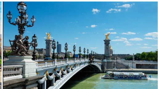
Paris: Paseo opcional en barco por el Sena y Notre Dame.