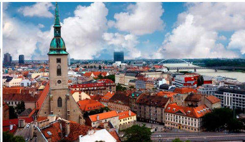
Bratislava: Memorias de un gran Imperio.