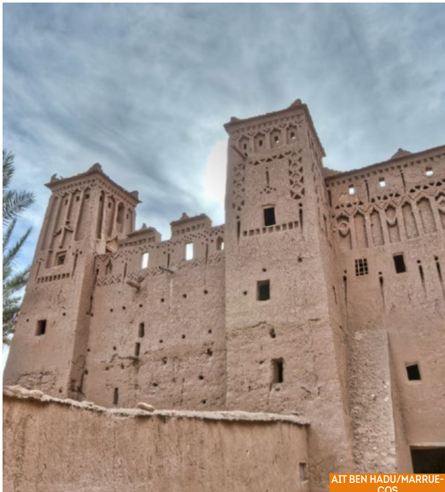
AIT BEN HADU/MARRUECOS

Nota: Desde mayo a mediados de octubre, por alta ocupación algunos grupos serán alojados en Bilbao.