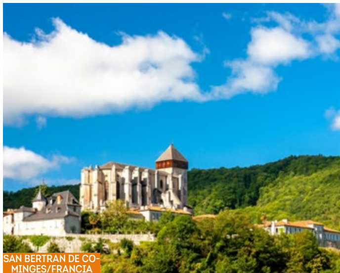
SAN BERTRÁN DE COMINGES/FRANCIA