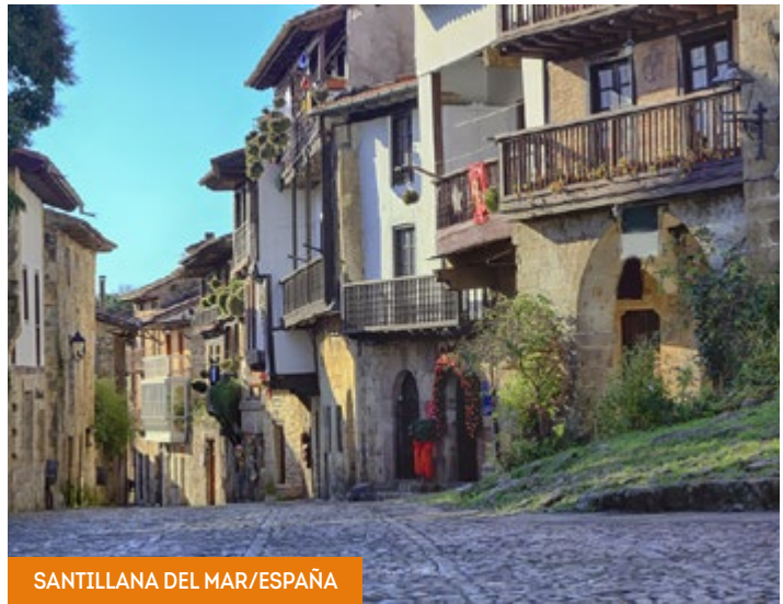
SANTILLANA DEL MAR/ESPAÑA