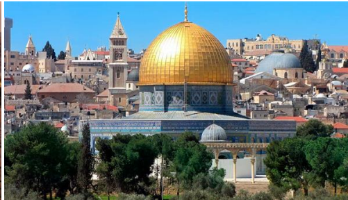
Jerusalem: Barrio ortodoxo Jerusalem.