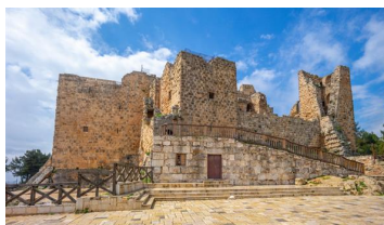
Castillo de Ajlun: Uno de los máximos exponentes de la arquitectura militar árabe.

Tras el desayuno continuamos nuestra visita de la ciudad. Conocemos (entrada incluida) el Heritage Village, lugar que nos permitirá conocer la vida tradicional en los Emiratos. Disfrutamos de sus vistas, podemos comprar en sus tiendas de artesanía y conocer sus pequeños museos que nos ilustran sobre la historia de los Emiratos. Tras ello incluimos la entrada y visita del Qasr Al Watan, el palacio presidencial de los Emiratos, magnífica construcción de granito blanco profusamente decorada donde destaca su cúpula de 37 metros y su lámpara de araña de 350 000 piezas de cristal. Posteriormente, nos dirigiremos al "distrito cultural" donde se encuentran varios museos entre los que destaca El Louvre, espectacular arquitectura junto al mar y colección de primer orden. Tiene usted la oportunidad si lo desea de visitar alguno de los museos del distrito o bien disfrutar de su tiempo libre en la zona. Almuerzo incluido. Tras el almuerzo. Fin de nuestros servicios.