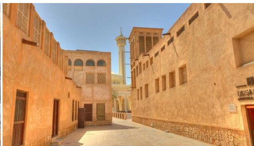
Dubai: Visita DUBAI clásico Heritage village-Bastakiya.