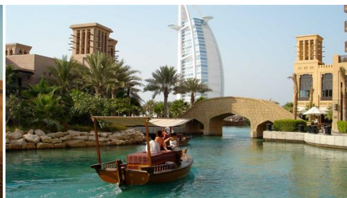
Dubai: Paseo en Abra (taxi acuático).