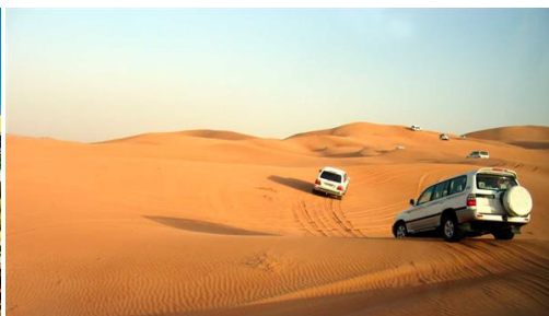
Dubai: Safari al desierto 4x4.