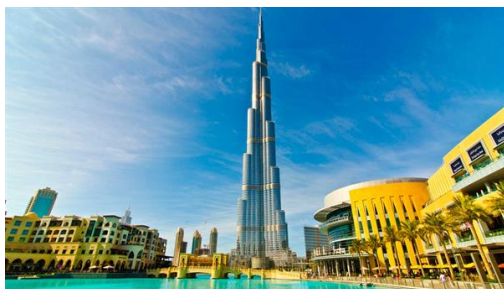
Dubai: Visita DUBAI moderno mezquita-palm Jumeirah.