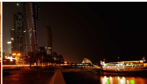
Dubai: Cena y espectáculo en embarcación Dhow.