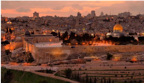
Jerusalem: City tour de Jerusalem.

Tras el desayuno, traslado al aeropuerto. Fin de nuestros servicios.